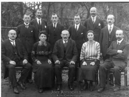
ตระกูลร็อทชิลด์ (Rothschilds Family)

“คุณต้องกล้าซื้อ เมื่อถนนนองไป ด้วยคราบเลือด แม้เลือดนั้น ส่วน หนึ่งจะเป็นของคุณเอง”